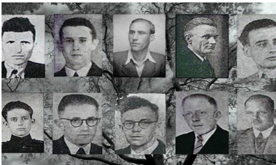
"De Tien van Renesse"

Alle tien werden ter dood veroordeeld door ophanging. Op 10 december 1944 werd dit vonnis voltrokken bij Slot Moermond in Renesse.