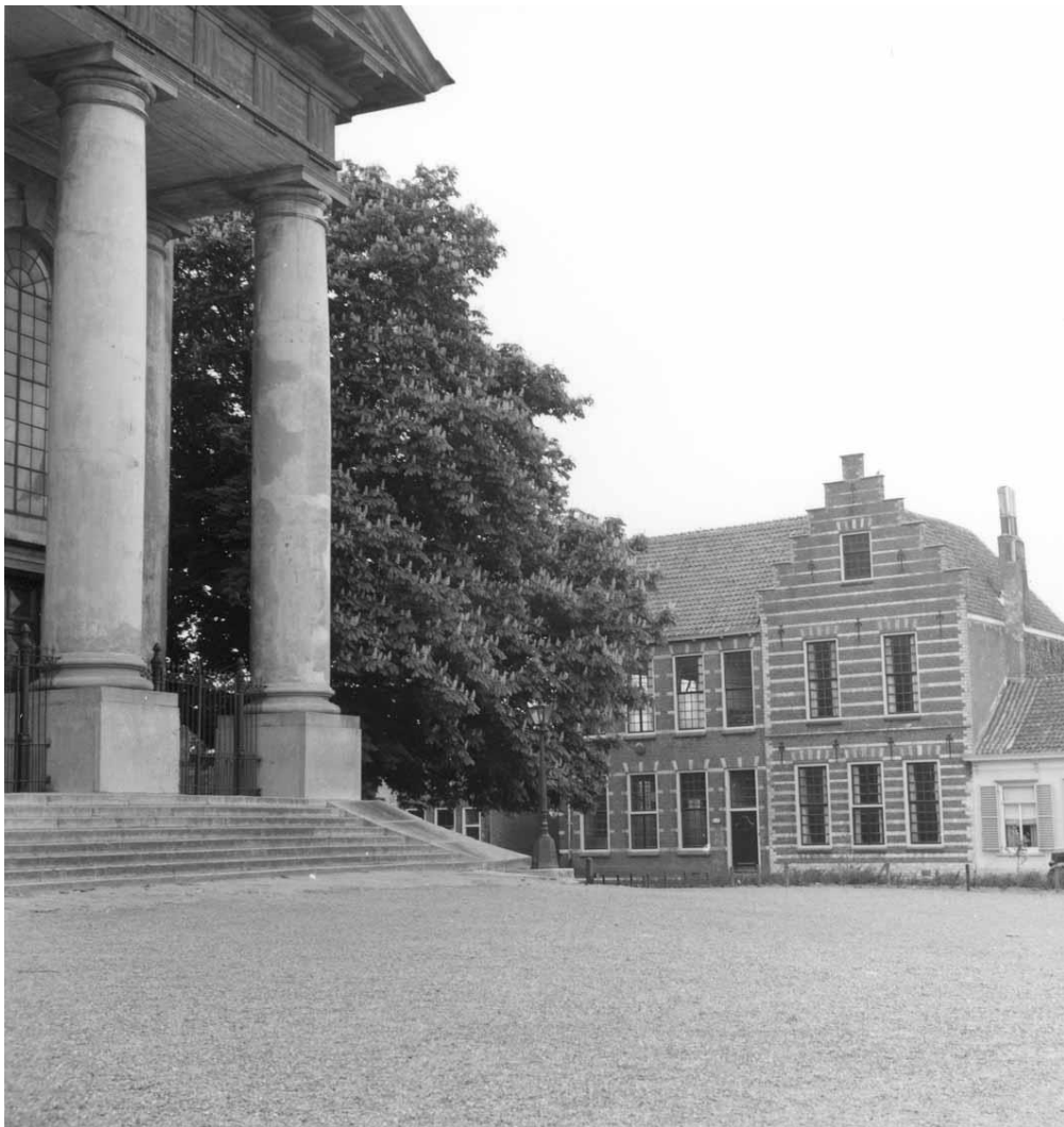
Gebouw De Driehoek

De Driehoek is in 1940 gevorderd voor huisvesting van Duitse militairen en als verenigingsgebouw van de NSB-Jeugdstorm.