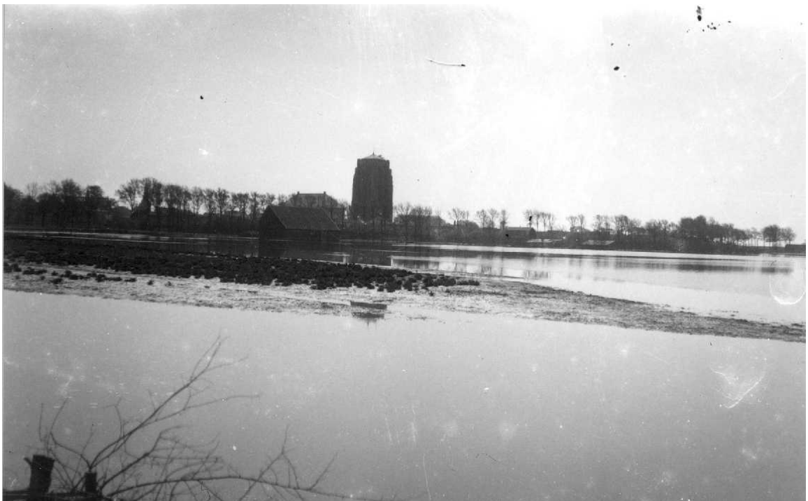
Ondergelopen weilanden ten noorden van Zierikzee als gevolg van de inundatie

Het duurde tot november 1945 voordat alle onder water gezette polders weer waren drooggelegd. De verzilte landbouwakkers moesten door beregening eerst langdurig worden gespoeld en daarna bewerkt met grote hoeveelheden landbouwgips. Pas na enkele jaren waren de akkers weer geschikt om te worden bewerkt.