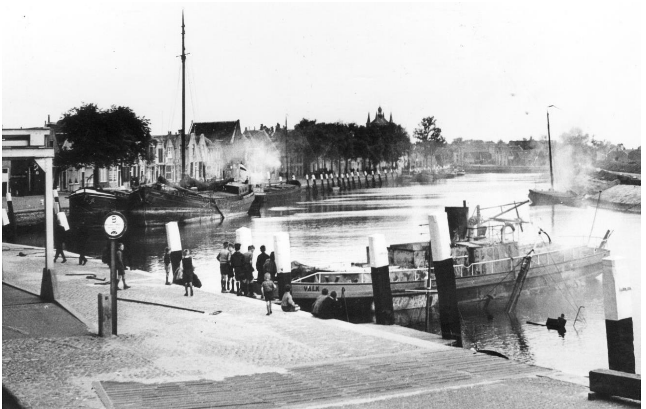
In brand gestoken schepen in de Nieuwe Haven

En zo kwam het dat schepen in de Nieuwe Haven door Nederlandse soldaten in brand werden gestoken en tot zinken werden gebracht om te voorkomen dat ze in vijandelijke handen zouden vallen.