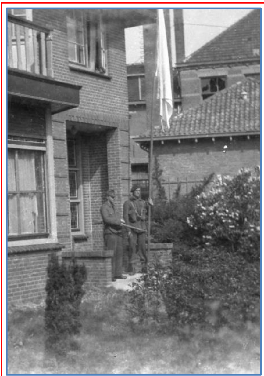
Een Duitse en een Engelse soldaat (met witte vlag) bij 't Vrije 55 tijdens het onderhandelingsgesprek op 7 mei 1945.

De volgende dag, op 8 mei 1945, was heel Schouwen-Duiveland na 5 jaar oorlog eindelijk bevrijd!