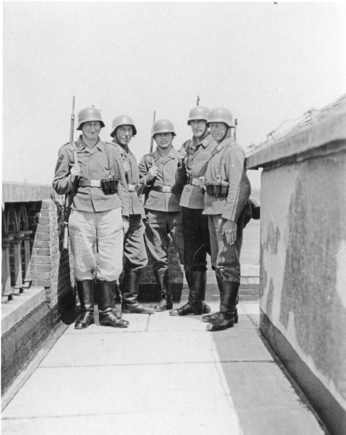
Duitse soldaten op de Sint-Lievensmonstertoren

Op 5 maart 1945 is de toren aan de zuidkant zwaar beschadigd door geallieerd geschut dat schoot vanaf het al bevrijde Noord-Beveland. Door restauratie van de toren zijn deze beschadigingen niet meer zichtbaar.