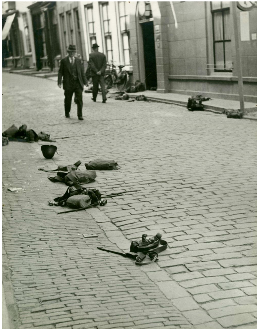
Door Nederlandse soldaten achterlaten uitrusting. Appelmarkt Zierikzee, 17 mei 1940

De Nederlandse soldaten gaven zich niet zomaar over. Onder andere vanuit de Beuze beschoten ze de vijand. Een Duitse militair werd in 't Visslop neergeschoten. Een Nederlandse soldaat sneuvelde op de hoek van de Nieuwe Haven en de Nieuwe Bogerdstraat.