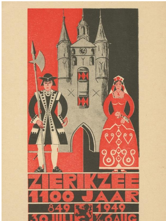
Affiche Zierikzee 1100 jaar in 1949

Op 7 mei 1945 werden op het Havenplein in Zierikzee de geallieerde soldaten feestelijk begroet, maar van een uitbundig bevrijdingsfeest was geen sprake. Een groot deel van Schouwen-Duiveland stond onder water en de meeste inwoners waren nog geëvacueerd.