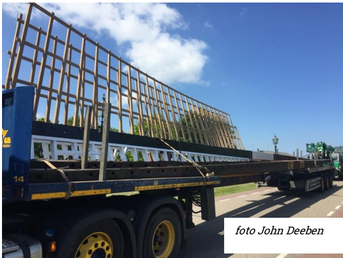
Aanvoer van de nieuwe wieken voor molen de Haan in 2018..

De molen is van binnen niet te bezichtigen, de wieken draaien vandaag wel.