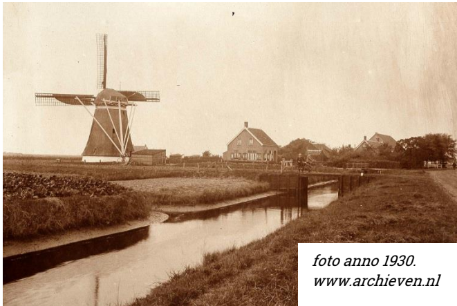
foto anno 1930.

"Eertijds was ik alleen van hout, maar nu in steen en riet herbouwd En hoger vlucht gegeven want door het malen van het graan Vindt gij al zoo ook Uw bestaan wat noodig is voor het leven. Wie alleman zijn goed vertrouwt en niet behoorlijk boeken houdt En veel verteer bij kleine winste en nimmer meer wil zijn de minste En zelden rekent, zelden schrijft, is 't vreemd, dat die geen koopman blijft?"