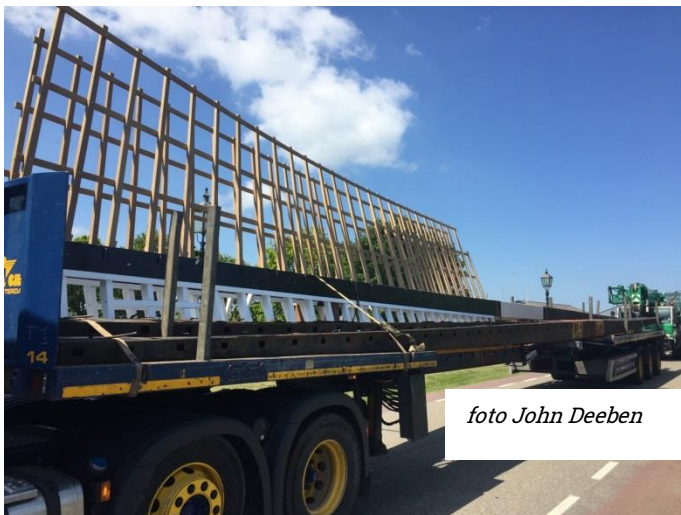
Aanvoer van de nieuwe wieken voor molen de Haan in 2018.

De molen is van binnen niet te bezichtigen, de wieken draaien vandaag wel.