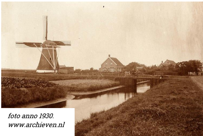
foto anno 1930.

"Eertijds was ik alleen van hout, maar nu in steen en riet herbouwd En hoger vlucht gegeven want door het malen van het graan Vindt gij al zoo ook Uw bestaan wat noodig is voor het leven. Wie alleman zijn goed vertrouwt en niet behoorlijk boeken houdt En veel verteer bij kleine winste en nimmer meer wil zijn de minste En zelden rekent, zelden schrijft, is 't vreemd, dat die geen koopman blijft?"