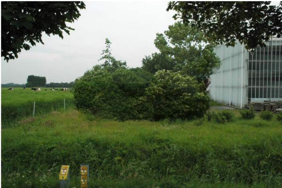
Huidige situatie 2020