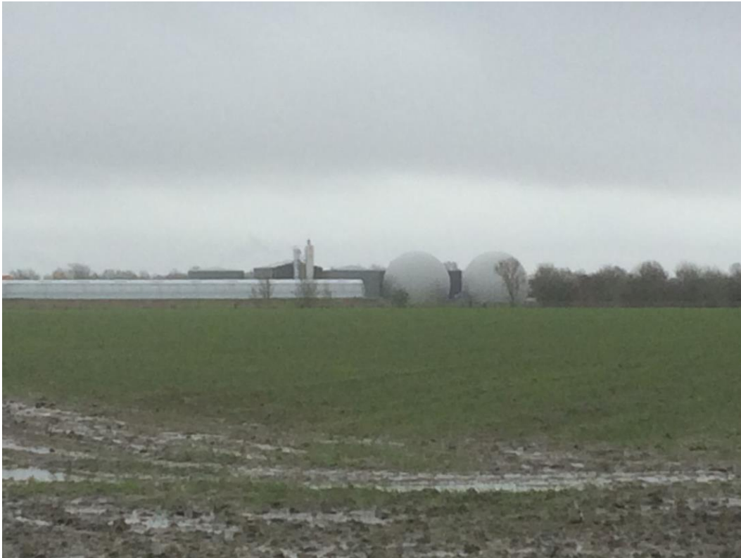
Huidige situatie 2020

Aangezien de biomassacentrale in Sirjansland gelegen is binnen het bestemmingsplan buitengebied, dient deze ook te voldoen aan de voorwaarden van dit bestemmingsplan t.a.v. landschappelijke inpassing.