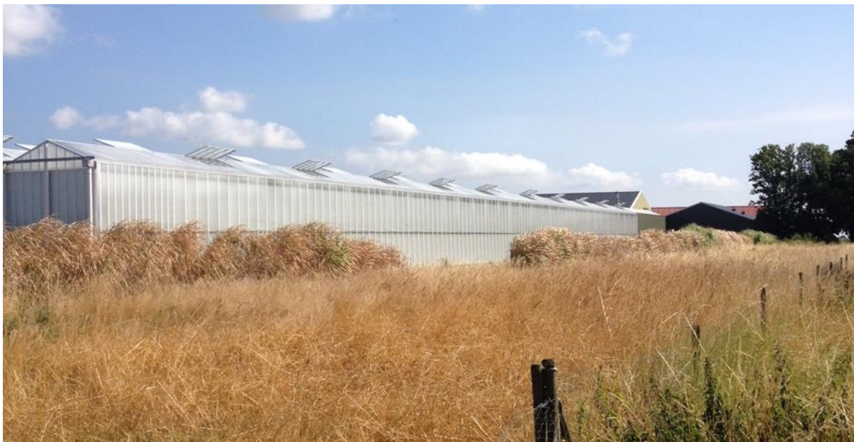
Situatie Kloosterweg 8 / Hanenweg, juli 2018

Getuige uw besluit is duidelijk is dat ook u een plantstrook van 10m breed een minimaal vereiste acht voor een goede landschappelijke inpassing. We leven nu in 2018 en kunnen 6 jaar later constateren dat van de landschappelijke inpassing weinig terechtgekomen is. De kaart "Huidige situatie 2017 Bloemenkwekerij van der Wekken" suggereert wat dat betreft veel meer dan in de praktijk zichtbaar is. Wij hebben vorig jaar ook al aangegeven dat de inpassing niet voldoet aan de eisen en u gevraagd om te handhaven. Dat is toen ook gebeurd. De heer Van der Wekken heeft het een en ander bijgeplant, maar het resultaat is nog steeds bedroevend en voldoet nog allerminst aan het gewenste resultaat*.